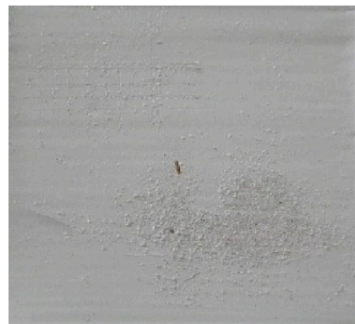
一般変成シリコン密着・汚染性